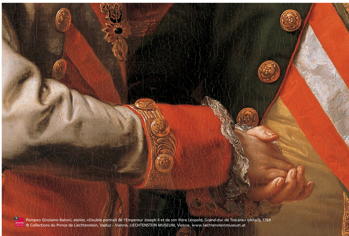
Pompeo Girolamo Batoni, atelier, «Double portrait de l'Empereur Joseph II et de son frère Léopold, Grand-duc de Toscane» (détail), 1769