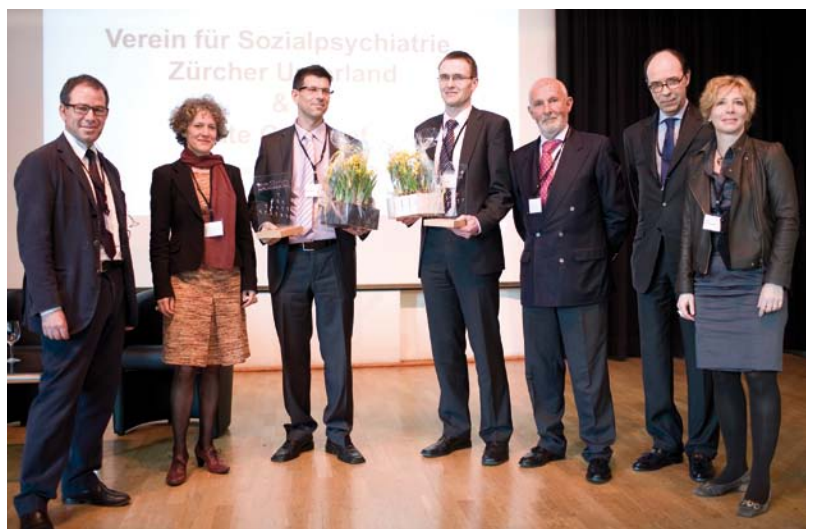
Remise du Humagora Award

Outre le traditionnel marché qui a permis aux uns et aux autres de se rencontrer et d'échanger autour de certains projets, la manifestation s'est articulée autour de deux sessions de travail sur le thème «Comment et pourquoi les organisations à but non lucratif et les entreprises créent des partenariats» - l'une consacrée aux connaissances théoriques nationales et internationales sur le sujet, l'autre à des expériences pratiques, d'un débat intitulé «Corporate Citizenship: Feigenblatt oder Kerngeschäft?» et de la remise de l'Humagora Award.