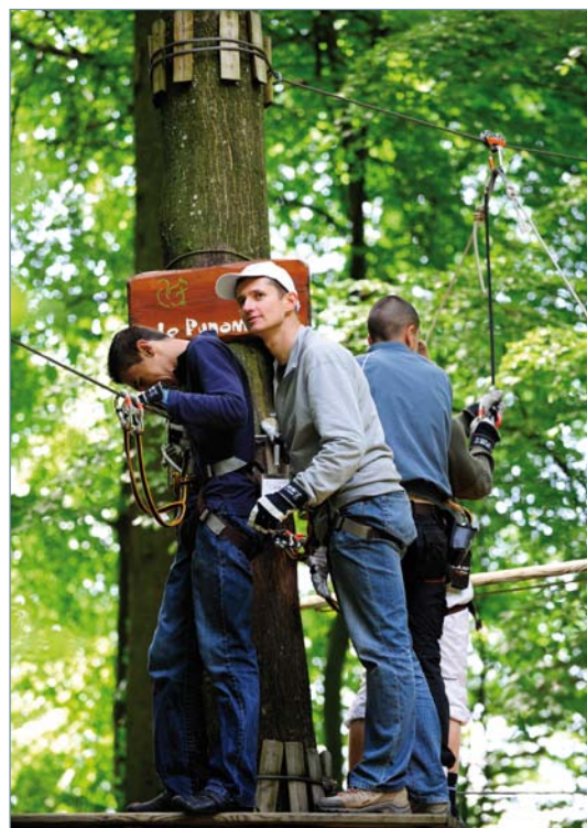
Dépassement de soi: parcours d'accrobranche entre des volontaires HSBC et des jeunes du SEMO de la Croix-Rouge (Genève)