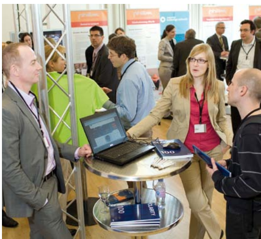
Echanges constructifs lors du marché interactif Humagora 2010

L'Humagora Award 2010 a été attribué au partenariat «wisli gate catering», un projet d'intégration professionnelle, initié en juin 2008, grâce à une collaboration entre l'entreprise Gate Gourmet et l'Association pour la psychiatrie sociale de la région Zurich Unterland, à travers l'entité Wisli ( www.wisli.ch ). Remis par Corine Mauch, Maire de Zurich, à l'occasion d'Humagora 2010 (voir ci-dessus), ce prix, décerné par un jury indépendant composé de représentants de services publics, du monde associatif et de l'économie privée, récompense un «in-house outsourcing» à l'aéroport de Zurich, dans lequel sont employées plus de 50 personnes souffrant d'une maladie psychique.