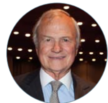
Claude Bébéar, Président d'Honneur de Philiass

La journée s'est terminée par un dîner rassemblant une vingtaine de chefs d'entreprises, membres ou non du Réseau Philiass, fertile en échanges et symbolique d'une réalité naturelle: l'implication du management supérieur est un facteur-clé de succès du développement de la RSE.