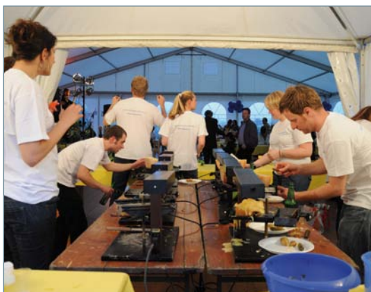
Pour les 30 ans de Make-A-Wish, MCI a offert une demie journée à ses employés afin d'œuvrer tous ensemble pour une même cause.

L'objectif de Philiass vis-à-vis de ses membres est de continuer à faciliter leurs initiatives en leur proposant une vie de réseau active ainsi qu'un soutien sur mesure pour ceux qui souhaitent être accompagnés dans la définition et la mise en œuvre de leur démarche RSE.