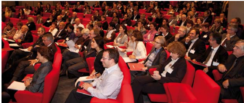
Plus de 200 personnes sont venues célébrer les 10 ans de Philiass

L'Arbre du 10 e , porteur de 53 propositions